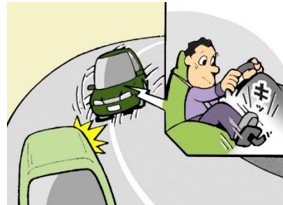
カーブでのスピード出しすぎ